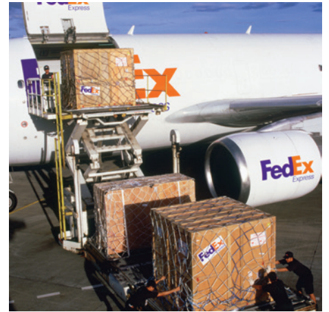
Expresso Internacional International Express