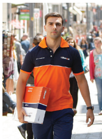
Expresso e Encomendas Express & Parcels