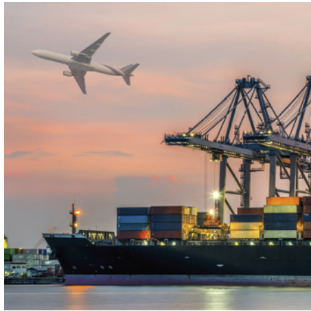
Transporte Aéreo e Marítimo Air & Sea Freight