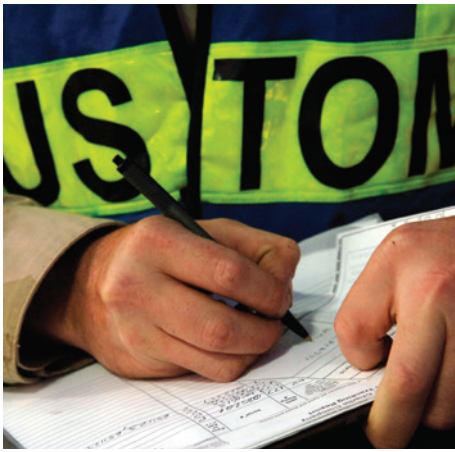
Atividade Aduaneira Customs Broker