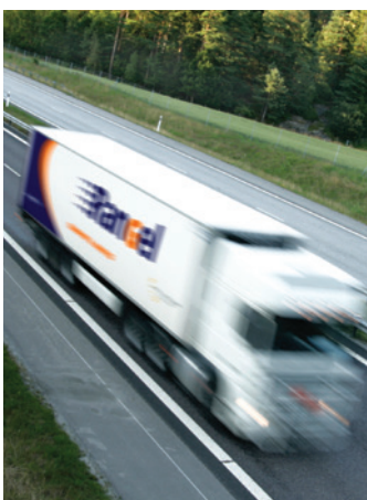
Transporte Rodoviário Road Freight