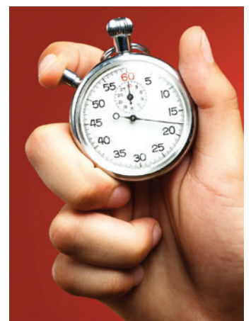
Custom Critical Time Critical & Special Projects